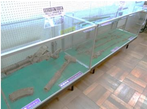
【郷土資料室での展示の様子】