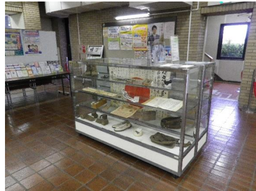
【西東京市役所（田無庁舎）での展示の様子】