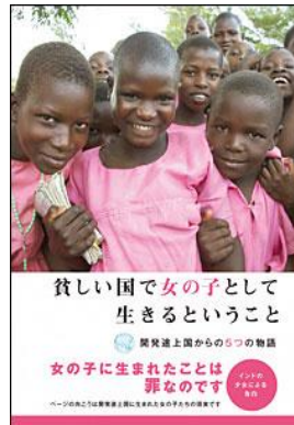
貧しい国で 女の子として生きるということ 開発途上国からの5つの物語 遊タイム出版/2010年 分類 10