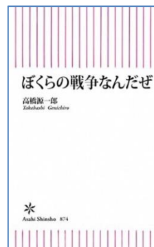
ぼくらの戦争なんだぜ 高橋源一郎 著 朝日新書/2022年 分類 15