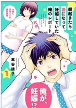
朝起きたら妻になって妊娠していた 俺のレポート 車谷晴子作 講談社/2020年 分類 23