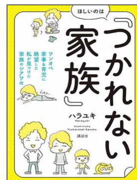
ほしいのは「つかれない家族」 ワンオペ家事&育児に絶望した私が 見つけた家族のシアワセ ハラユキ著 講談社/2020年 分類 23