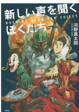
新しい声を聞く ぼくたち 河野真太郎著 講談社/2022年 分類 8