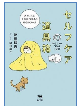
セルフケアの道工具箱 ストレスと上手につきあう100のワーク 伊藤絵美著・細川紹タイラスト 晶文社/2020年 分類 14