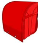
landoseru (school bag)