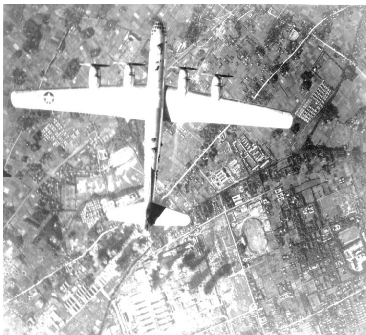
「1945年 西東京市を爆撃するB29」

しじゅうから第二公園や東伏見稻荷神社など西東京市近辺の戦跡や 戦争とゆかりのある場所を巡るフィールドワーク