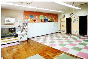
柳沢公民館保育室