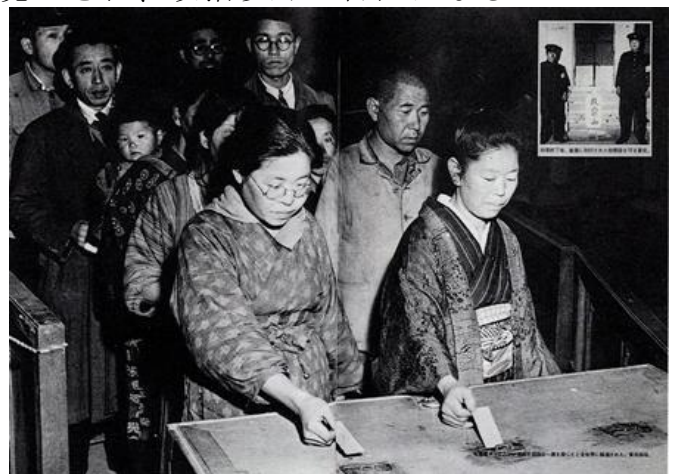
戦後初めての総選挙