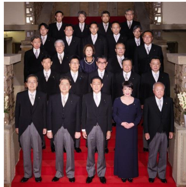
第 2 次岸田内閣閣僚