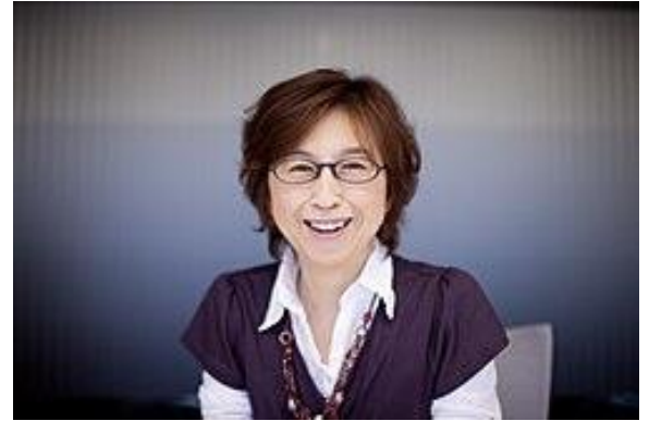
南場智子経団連副会長

* 政府は 2003 年に「指導的立場に占める女性比率 30%を 20 年までに達成する」としたが、「20 年代早期」に先送り。