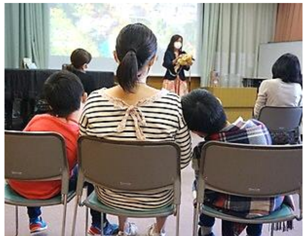
2020年 イライラを減らす勇気づけの子育てとは