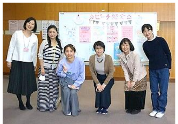
ピーチのみんなでパチリ