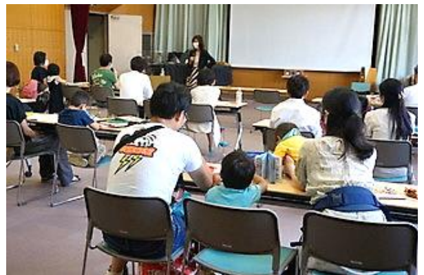
2021年 笑顔あふれる家族の絆を育むかわり方！

学校や保育園・幼稚園のママ友とも違う仲間とよりよく生きたいと思う方、ぜひ一緒に活動しませんか？