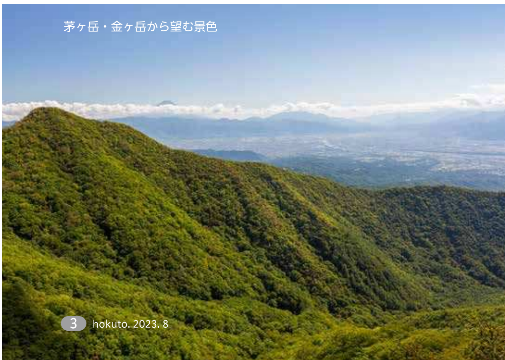
茅ヶ岳・金ヶ岳から望む景色

4～5ページでは、それぞれのユネスコエコパーク地域連絡会の会長に取組内容などをお話いただきました。