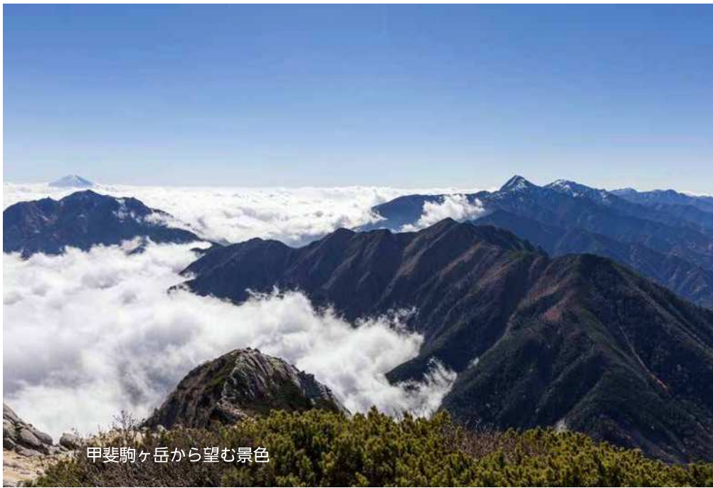
甲斐駒ヶ岳から望む景色