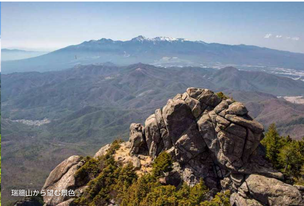
瑞牆山から望む景色