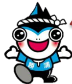
勝浦市マスコットキャラクター「勝浦カッピー」