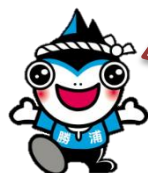
勝浦市マスコットキャラクター 「勝浦カッピー」