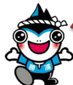
勝浦市マスコットキャラクター「勝浦カッピー」