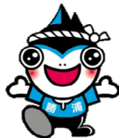
勝浦市マスコットキャラクター「勝浦カッピー」