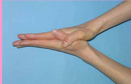
手の甲を、もう一方の手のひらでこする

手指を流水でぬらし、石けん液または消毒剤を手のひらに取る 手のひらをすりあわせ、よく泡立てて洗う 指の間をよく洗う