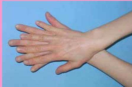
親指を包み込むようにこする