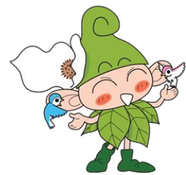
西東京市マスコットキャラクター 「いきいーな」