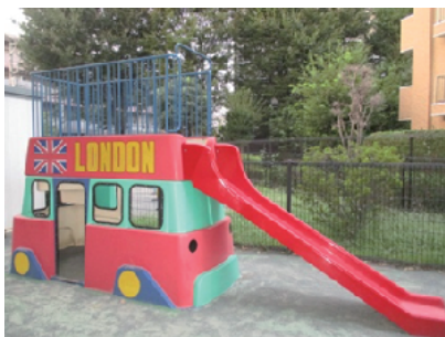
はこべら保育園 園庭遊具