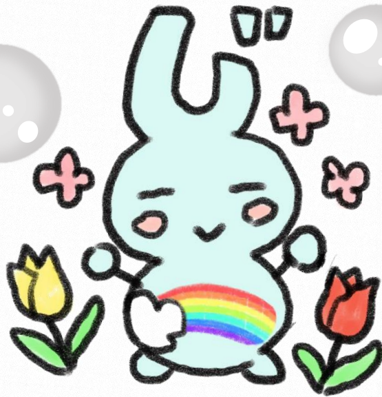
西東京市児童館キャラクター 「にじポン」

学童クラブは、 毎年、入会申請手続が必要です。 ( 児童による提出はできません。郵送による申請が可能です。 )