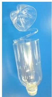
切ったところの拡大