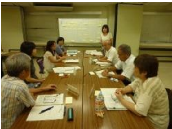
写真 ワークショップ実施状況