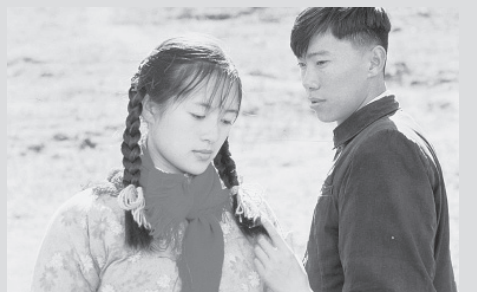
(C) 2000 COLUMBIA PICTURES FILM PRODUCTION ASIA LTD. ALL RIGHTS RESERVED.