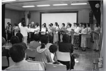
昨年のフェスティバルの様子