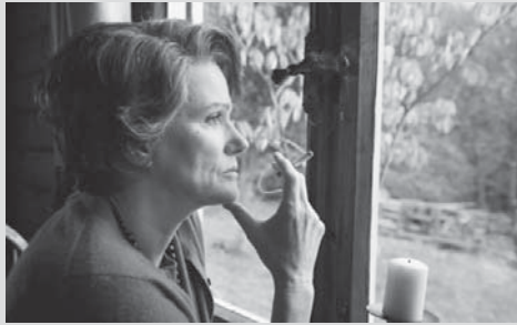
©2012 Heimatfilm GmbH+Co KG, Amour Fou Luxembourg sari, MACT Productions SA, Metro Communications Ltd.

「考えることで、人は強くなる」 ナチスから逃れアメリカに亡命した政治学者アーレントが、激しいバッシングをあびても、ぶれることなく伝えたこととは?