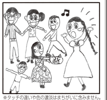
※タッチの違いや色の濃淡はまちがいに含まれません。