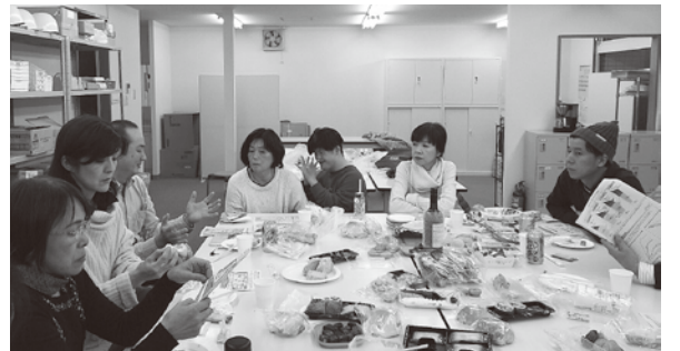
円卓会議後に立ちあがった市民グループ「ノーマライゼーション西東京の会」の勉強会

数年前に障がいのある人もない人も分けない居場所づくりというテーマで開催された円卓会議のメンバーに入れていただいたおかげで、地域で活躍中の異業種の方たちとつながることができました。いろんな人がご