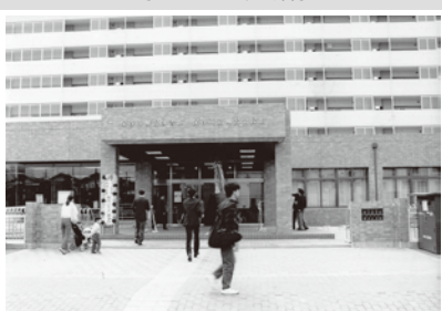
開館日の柳沢図書館・柳沢公民館 昭和62年4月1日撮影