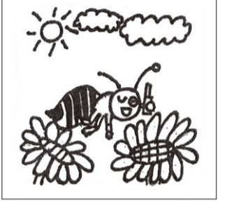
※タッチの違いや色の濃淡はまちがいに含まれません。