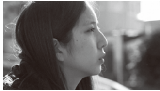
(監督:早川千絵/2016年/日本/22分)

単身女性の3人に1人が貧困状況にあるといわれています。若年男性やシングルマザーに比べ可視化されることが少ない若年シングル女性の生きづらさ、働きづらさについて考えます。