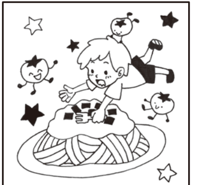
※タッチの違いや色の濃淡はまちがいに含まれません。