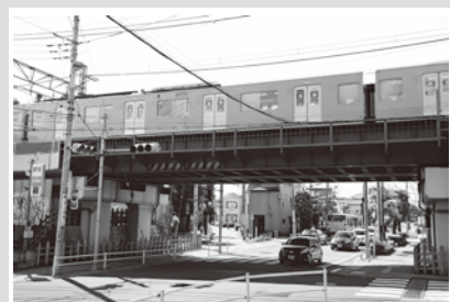
現在の様子