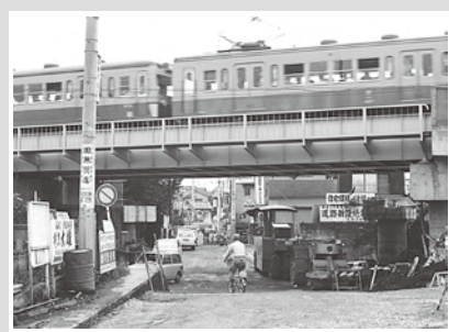
右方向に田無駅 昭和48(1973)年撮影

田無駅東側の西武新宿線高架下道を通る市道119号線は、平成3年7月6日に武蔵境通りまで開通しました。