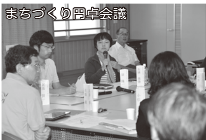
※会のホームページがあります。 https://nishitokyo-afterschool.jimdo.com/

したので。その後、メンバーが中心となって、青嵐中学校、ひばりが丘中学校でも放課後カフェが開かれるようになりました。 「放課後カフェは、学校がある地域の人たちの思いで、地域の人たちによって開かれ、運営されるもの。私たちは、それをお手伝いする伴走者」 このように考える会では、カフェを開きたい人を対象に、運営方法などを学ぶ機会を提供しています。全校で開催されるようになったら、交流のための連絡会を立ち上げたいという抱負も持っています。