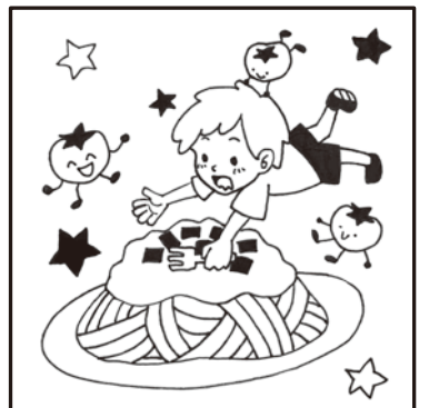
※タッチの違いや色の濃淡はまちがいに含まれません。