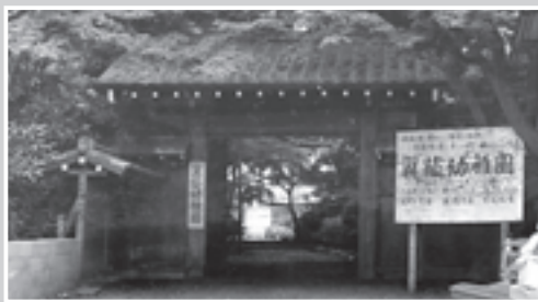
翼蔭幼稚園 昭和37（1962）年撮影

翼蔭幼稚園は、現在、西東京市向台公園になっています。当時の門は平成23年に解体されましたが、その柱は現在の門の柱に再利用されました。