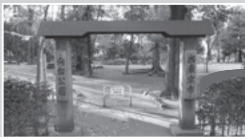
西東京市向台公園