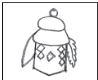
※タッチの違いや色の濃淡はまちがいに含まれません。

記念日にちなんだまちがいがし絵をお楽しみください。まちがいはのこ。解答は2面下。