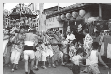
昭和37(1962)年頃撮影