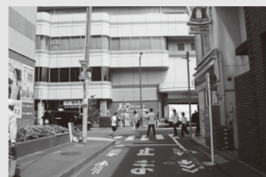
写真の場所には、現在、アスタビルが建っています。