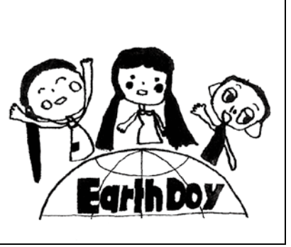
※タッチの違いや色の濃淡は間違いに含みません。