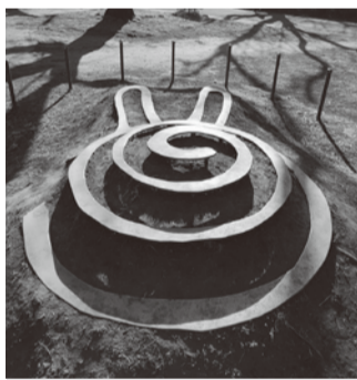
②「グー・チョコキ・バー」/ステンレススチール、土、タマリユウ/長澤伸穂(のぶほ) 世界各地で使われている子どもの遊びを表現。コミュニケーションが渦を巻いて広がることを願う。