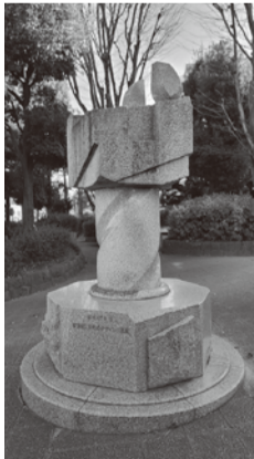
④「廻り岩」/不明/半田富久 太古より人々が抱えてきた「神の力が巨石を動かす」という思いを作品に託し、地域を見守る象徴とした。

わが街をもっと知りたくて ちよごと彫刻さんぽ 第2回 文理台公園・谷戸イチョウ公園 市内にある野外彫刻を編集室が取材紹介する「彫刻さんぽ」。第2回は文理台公園と谷戸イチョウ公園です。それぞれ三つの彫刻があり、きつと知らなかった作品に出会えるでしょう。 文理台公園(東町1-4)の入口広場に建つ①「母子像」。1984年の開園以来、母子の笑顔が来園者を優しく迎えます。右手奥の緑地に進むと、盛り上がった地面にじゃんけんの手の形を表現した②「グー・チョコキ・バー」を発見！子どもが自由に遊ぶことを目的に作られた作品ですが、楽しさ満載で大人も童心に返って遊びたくなります。中央のグラウンドの北、ポンプ場に続く丘陵に広がるのは③「East Asian Time Terrace(イースト・エイジアン・タイム・テラス)」。文理台公園の広さや地形を生かしたスケールの大きな作品です。 一方、谷戸イチョウ公園(谷戸町2-12)の開園当初(1987年)からあるのは④「廻り岩」。石に地域を守る願いを託しました。公園のシンボルとして親しまれているのが、西側にある高さ6mの石のモニュメント。⑤「桌の化石」と名付けられたこの作品は、作者いわく「数万年後に20世紀の化石の一つとして出土する」と壮大なロマンを秘め、見る者の想像力をかき