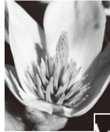
写真① ハクモクレン

まず花の色・形など、昆虫との関係です。年明け後、ロウバイ、マンサクに続き、トサミズキ、キブシ、サンシュユなど早春には黄色い花が多く 30~40%を占めている感じがです。色彩の少ないこの時期、澄んだ青空に補色の黄色は非常に目立つ色で、いち早く活動するアブ、ハエ、ハチ類に花粉を運んでもらう戦略のように感じられます。形も、ミズキやヤブガラシのように上向きに咲く小さな花の集まりであればどんな昆虫でも蜜が吸え、その代償として花粉を運んでもらえます。しかし下を向いた壺形のアセビやドウダンツツジなどであればハナバチ類しか潜れ