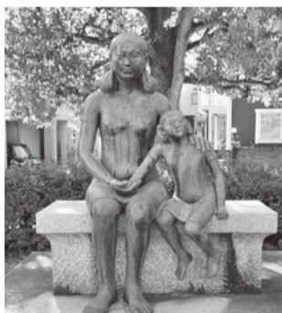
①「母子像」/ブロンズ、御影石、花こう岩/細井良雄 母子のふれあいと穏やかな表情を通して、平和の大切さを訴える。