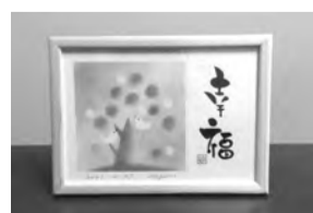
◀作品はA5サイズ(講師作品)