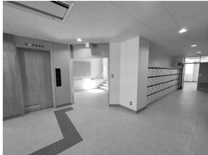
▲2Fエレベーターホール。団体連絡箱を、こちらと地下階に移設しました。団体連絡箱は94箱(2Fに56箱、B1Fに38箱)設置しています。

声の「公民館だより」をお届けしています。知り合いで希望される方がいらっしゃいましたら、谷戸図書館(電話042-421-4545)へお問い合わせください。