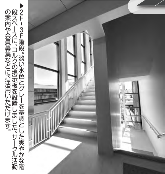
▲2F-3F階段。淡い水色とグレーを基調とした爽やかな階段スペースに、コルクの掲示板を設置しました。サークル活動の案内や会員募集などに活用いただけます。