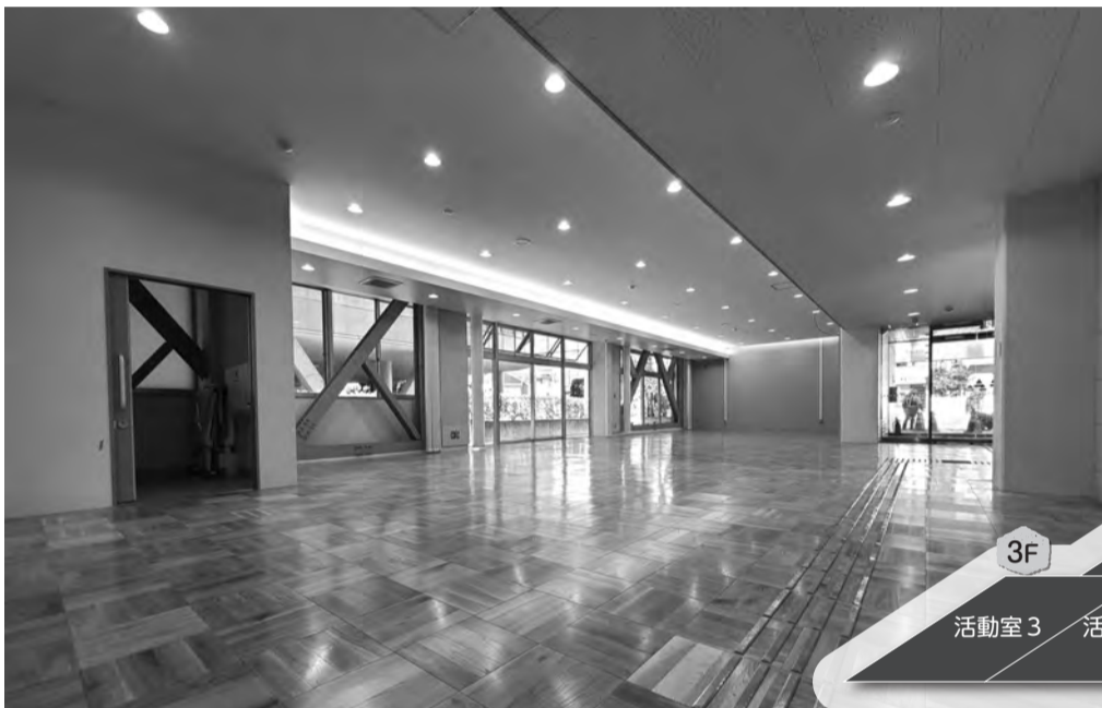
▲1Fロビー。フリーWi-Fiを整備し、写真奥のエリアは学習コーナーとなりました。全館LED照明となり、環境に配慮しながら明るく快適な空間になりました。またピクチャーレールを設置し展示の利便性が向上しました。

田無公民館は4月1日(金)午前9時に再開します。今回の改修工事では、耐震補強等による施設の安全性確保に加え、施設内のレイアウト変更や設備の更新を行いました。ご利用いただける部屋が1つ増え、実習室の調理台、ガス台、オーブンを刷新するなど、より快適にご利用いただけるようになりました。また、授乳室の新設、誰でもトイレの更新など、子育て中の方や障がいのある方をはじめ、どなたにもより安心してご利用いただけるようになりました。生まれ変わった田無公民館にぜひお越しください!