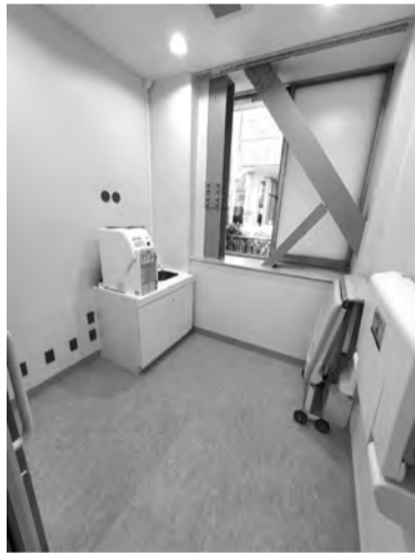
▲1F授乳室。乳幼児連れの方にも安心してご利用いただけるよう、調乳専用の浄水給湯器、おむつ替え用の台、簡易ベッドを設置しました。