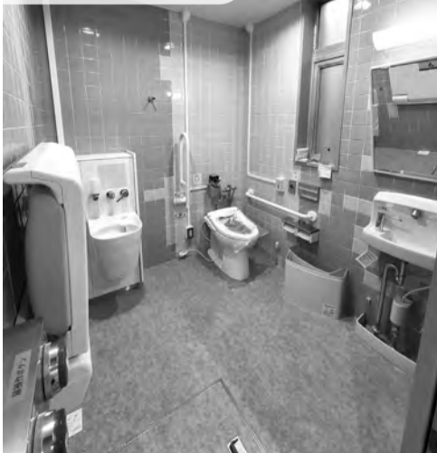
▲1Fだれでもトイレ。ウォシュレット、おむつ替え用の台、オストメイト専用流し台を設置しました。