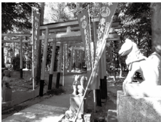
▲東伏見稲荷神社の鳥居とキツネの像