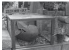
▲“250kg爆弾”不発弾の破片 延命寺