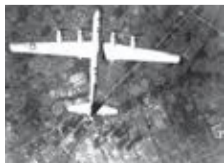
▲1945年 西東京市を爆撃するB29