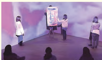
Dismantling Motherhood 2024 (C)坂本夏海

フォームでひばりが丘公民館へ(定員に満たない場合、保育を利用しない方は申込順で3月12日(木)17時まで申込可)