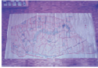
ちまかせいせい 地租改正絵図 (市文化財第18号)