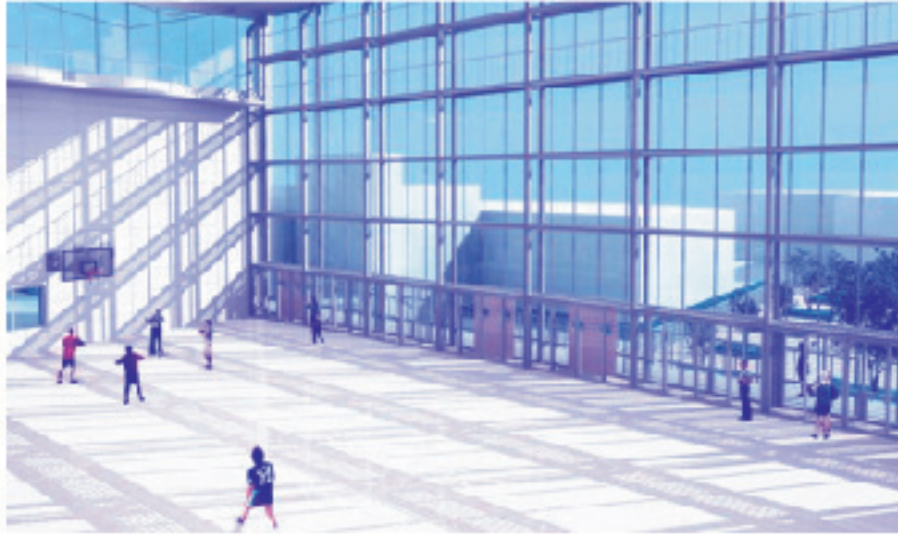
体育館イメージ(上・外観、下・内部)