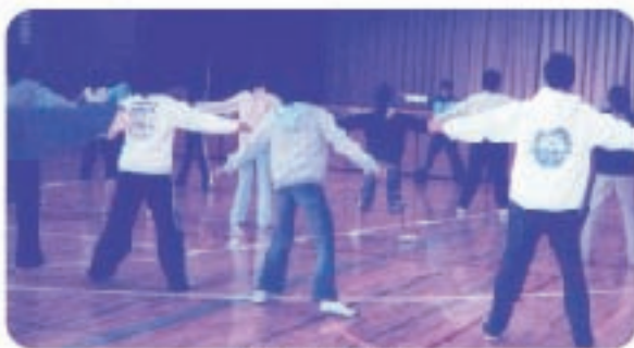
ヒップホップ教室

現在、小学校7校で学校施設開放運営協議会により、主に児童・生徒を対象にした文化・スポーツの学習活動、体験活動を行っています。今年度は更に3校を加え、10校で行います。