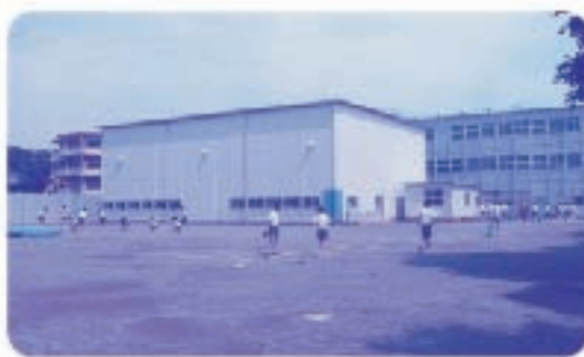
青嵐中学校仮設校舎

○小学校図書室空調設備工事 小学校6校(泉・谷戸第二・東・柳沢・上向台・住吉)に設置します。この工事により全小学校図書室への設置が完了します。