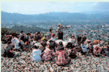
忘れられない思い出(東伏見小学校)