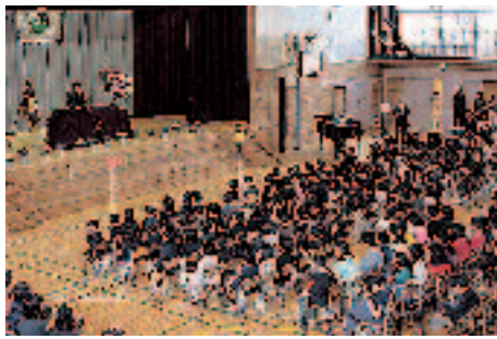
入学式(中原小学校)

大きなランドセルを背負って、期待と不安のピカピカの1年生、進級した上級生も新たなクラスに胸ときどきです。さあ、新年度のスタート。子どもたちの「こんな一年にしたい」の声を聞いてみました。