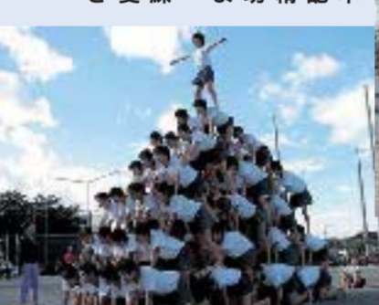
大成功の立体ピラミッド

学芸会 栄小学校 2年に1度、学芸会を行っています。子どもたちの表現活動を膨らませる場として、自主性や創造性を大切に取組んできました。今年度も様々なドラマが生まれ、児童の感想文を紹介します。 学芸会当日、体育館の外で待つたけど、中に入るといきなり心臓がドキドキしてきました。ぼくは、最初のセリフ、心の中、劇の始まりのプザーが鳴り、余計に緊張してきました。一回めのプザーが鳴ったとき、ぼくは一回、深呼吸をしてから、セリフを言い始めました。それから第一幕が終わって、下手に入った時は、ホッとしました。劇は進み、最後のカーテンコールの時に、たくさんの拍手をもらい、ぼくはとても