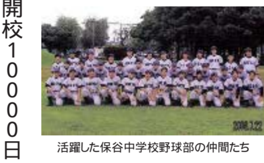
活躍した保谷中学校野球部の仲間たち

開校10000日 本町小学校 昭和54年4月1日に本町小学校が開校し、8月17日で10000日になりました。子どもたちが登校してくる9月11日に開校10000日を祝う会を行いました。月曜日の朝会と1時間目を使って、ゲームなどをして楽しく過ごしました。栄養士さんと相談して、給食でケーキを食べてお祝いしました。