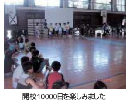
開校10000日を楽しみました

たてわり班集会 東小学校 1年生から6年生まで、各学年が数名ずつ集まり、たてわり班を作り、月に1回、一緒に遊ぶ活動を行っています。短い時間ですが、6年生の班長を中心に、良くまとまって楽しい時間を過ごしています。 たてわり班集会では、月に一度1年生から6年生までが入り交じった班ごとに遊びを決め、遊びます。主に遊びは6年生を中心に決めていきます。みんなが楽しめるような遊びを考えたり、準備をしたり、みんなをまとめるための役なのでとても大変です。けれども、みんなが帰っていくときに、楽しかった、と言ってくれると、とてもやりがいを感じます。1年間のたてわり班集会を通して、このように他の学年と交流できることは、とても楽しいことだということが分かりました。(6年女子)