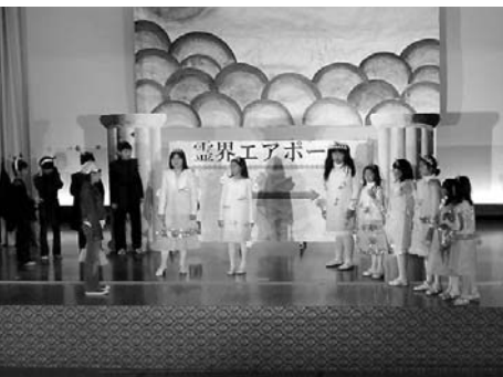
学芸会で演技する子どもたち