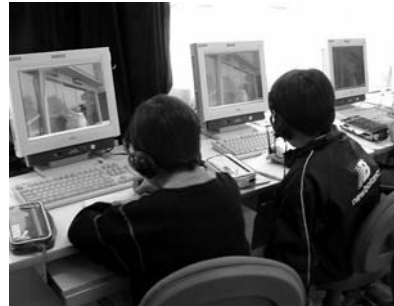
パソコンを使っでの情報教育

特別支援教育普及啓発事業費 特別支援教育対象の児童・生徒に関する個別の指導計画書及び個別の教育支援計画の作成や、特別支援教育に対する事業の啓発活動を行います。 特別支援教育相談関連事業費