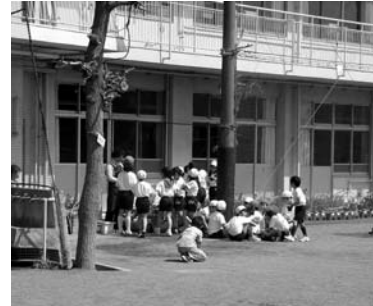
学習活動イメージ