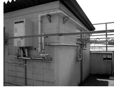
プール用温水シャワー設置工事

プール用温水シャワー設置工事 児童・生徒の衛生管理のため本年度は小学校3校(谷戸第