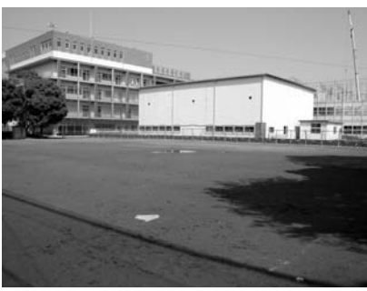
青嵐中学校校舎建替工事

体育館大規模改造工事 谷戸及び向台小学校の体育館の老朽化に伴い、改造工事を行います。 校舎増築設計委託 上向台小学校の児童数の増加に伴い、校舎増築に伴う実施設計の委託料を計上します。 体育館耐震補強工事 生徒の安全を確保するため、田無第三中学校の体育館耐震補強工事を行います。これにより西東京市内の小・中学校の校舎及び体育館の耐震工事はすべて完了します。 青嵐中学校校舎建替工事等 平成18年度末までに校舎は完成しましたが、引き続き校庭の整備工事、旧校舎の解体工事及び仮設グラウンド復旧工事を実施します。