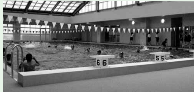
新しいプールでの初めての水泳授業