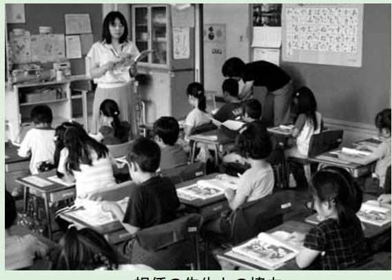
担任の先生との協力

本紙5月号でお知らせした「学習支援員」の配置を5月21日(月)から開始しました。 第1学年で児童数が35人以上の学級が1学級または2学級ある学年には1人、3学級または4学級ある学年には2人を配置することになっております。本年度は、7校に9人を配置しました。 配置された学習支援員の活動報告書から所感を紹介します。 子どもたちは全体的に、素直で明るく伸び伸びしています。気になったことは、朝から机に上半身を持たれかけ背筋が伸びせない子が数人いたことでした。注意すると背筋を伸ばします。 1年生は、元気はよいのですが、全体的に落ち着きがありません。特に、休み時間などで、担任の先生が少し席をはずしたときが大変だと感じました。 教育指導課 042-438-4075