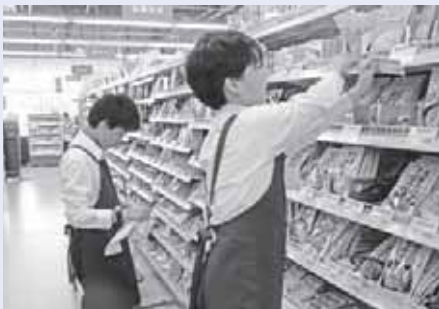
商店での職場体験の様子

お客様へのあいさつの仕方や接し方など、いろいろ学ぶことがありました。レタスを包んだり、レジでお金を渡したりすることは大変でしたが、お客様へかごを渡してほめられた時や、