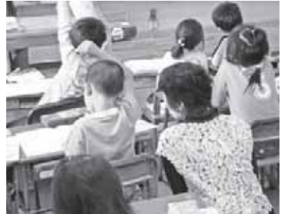
児童に寄り添う学習支援員

配置された学習支援員は、学校生活への適応に関する補助や学習指導、給食指導などの補助をしています。