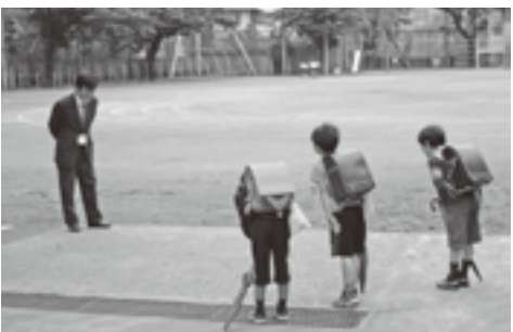
校長によるあいさつ運動の様子

○全校朝会でのあいさつ指導 ○校内掲示の工夫 ○教員による「あいさつ運動」の強化