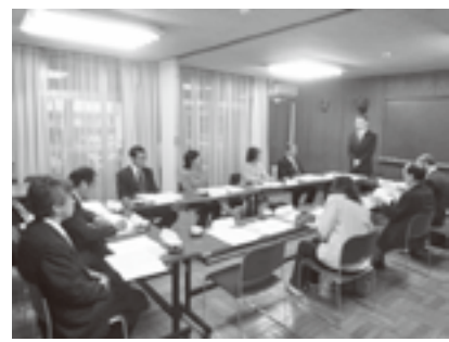
学校関係者評価委員会の様子(田無第二中学校)