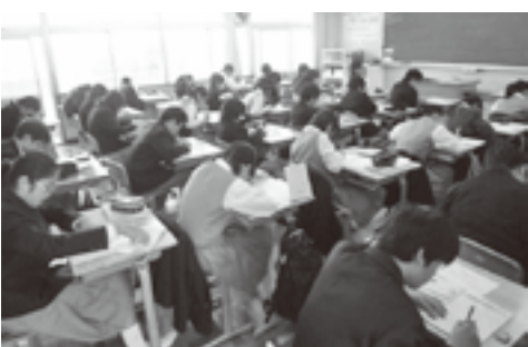
集中して朝学習(二中タイム)に取り組む生徒

○提出率の向上を図る ○生徒自らが自己の課題を設定し、自学自習できる力を身に付けさせる指導を強化する