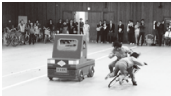
スタントマンによる交通事故の実演

都内における自転車に関係する交通事故は、人身事故全体の約35%を占めており、特に歩行者と衝突する事故は、年々増加しています。また、多くの中学生が自転車を利用している実態があることや自転車利用中に交通人身事故の当事者となる可能性があることなどから、自転車利用に関する交通安全教育を充実させることが課題となっています。 このことを踏まえ、西東京市教育委員会では、スタントマンを活用した自転車安全教室を実施します。自転車安全指導の充実と生徒が交通事故の被害者や加害者にならないように交通安全に対する意識を向上させるために行います。 本教室は、本年度から平成24年度までの3年間で、市立中学校の全校で実施する予定です。