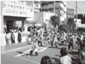
「TANASHI ソーラン会」の皆さん

西東京市の西の端の住宅地に位置し、芝久保図書館と併設した建物が芝久保公民館です。ロビーを入ると、正面にガラスケースがあり、月ごとに作品を展示する「小さな展示会」が開かれています。また、ロビーには新聞閲覧コーナーと座談コーナーがあり、住民の皆さんのいこの場となっています。 施設は地上2階となっており、2つの会議室の他に、和室、視聴覚室、創作室、保育室、印刷室があり、様々なサークル活動が盛んに行われています。また、創作室には工作・陶芸機能が整備され、陶芸・木工・ステンドグラス等の活動に使われています。 当館では公民館が主催する利用者懇談会とは別に、利用サークルが自主的に結成している芝久保利用者連絡会が活動していることも大きな特徴です。公民館との連携を取りながら、利用者目線で公民館に関する課題を話し合う会を定期的に開催しています。積極的に公民館や地域の課題に取り組み住民の多さもこの地域ならではのものです。 秋には「芝久保公民館まつり」を開催しています。利用サークルが中心となって準備会を発足し、実行委員会を組織し、会議を重ねて行われる手作りのおまつりです。今年で28回目を迎えます。 芝久保公民館 042(461)9825