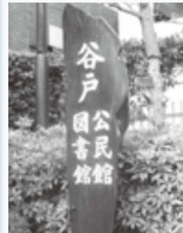
利用者の想いが詰まった手作りの看板

この森公園入り口前の都営住宅の一角に位置し、谷戸図書館と併設です。 入り口では、地域に多くあった桜の木を伐採を惜しんで、利用団体がその木を使って手作りした看板が迎えてくれます。 施設は会議室仕様が2部屋、お茶や日本舞踊などに利用する和室、16mm映写機を常設し音響設備の充実した視聴覚室、昨年8月に開設し多目的に利用できる創作室などがあります。視聴覚室では市民映画会やコンサートの開催し、創作室は給湯設備を施し、絵画や書道・工作等に幅広く活用されています。 また、1階ロビーは展示会場だけではなく、誰でも集える場として開放され、ここにも利用団体手作りの桜の木の手づくりがあります。 地域に小・中学校4校があり、児童生徒がこのテーブルで勉強している姿も多く見かけます。 最大のイベントは、4月に開催する「谷戸まつり」です。毎年オープニングとして、田無二中のプラスバンド演奏が始まり、「公民館まつり」ではない地域のまつり」との参加者の想いを重ねながら、22年間続いていきます。 利用団体をはじめ、地域の小・中学校、地域協力店や自治会、交通安全協会などの参加協力も得て、地域交流の場として今では欠かすことのできないまつりです。実行委員会形式で半年間の準備期間を経て、今年も多くの方々に来館いただきました。 谷戸公民館 042(421)3855