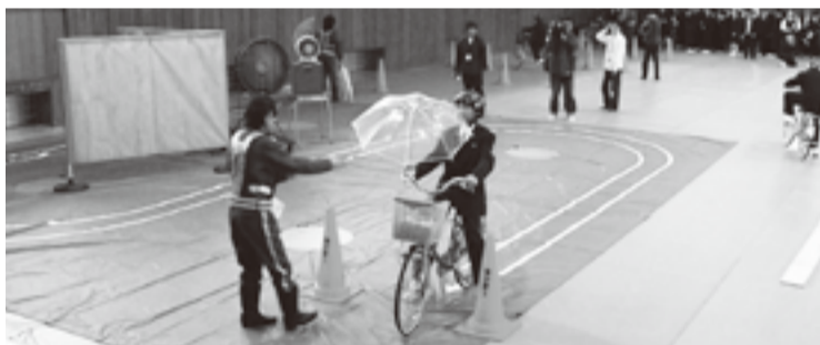
傘をさしての自転車走行の体験

平成22年度実施校 田無一中、保谷中、田無二中 平成23年度実施校 ひばりが丘中、青嵐中、柳沢中 平成24年度実施校 田無三中、田無四中、明保中