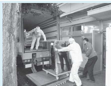
②中学校の給食時間に間に合うよう、専用の給食コンテナに積載しトラックで運びます。