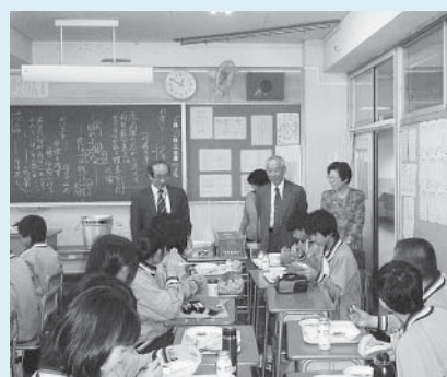
⑥各教室で給食の様子を見学しました。

※第2期中学校完全給食整備に係る小学校給食室改修等工事を夏休みに実施する予定です。また、中学校について、年度内に昇降機設置等工事を予定しています。