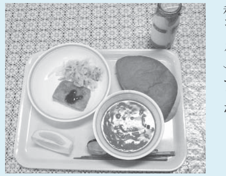
④当日の献立はハムカツサンド(セルフ)、野菜とインゲン豆のトマト煮、牛乳とミカン(宇和ゴールド)でした。