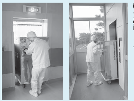
③中学校側では給食コンテナをエレベーターで各フロアへ運び、配送員により指定された場所へ設置します。