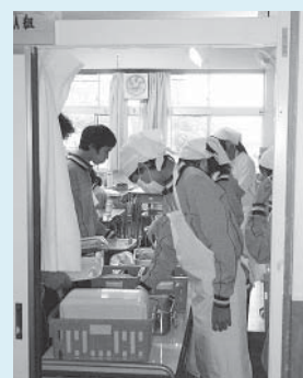
⑤教室での配膳の様子。給食開始から1週間で給食当番の手際も良くなりました。