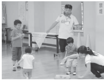
みんなでこま回し!

参加した方からは「子どもが喜んでよかった」、「保護者同士で話げできた」、「市内の子どもの遊び場がわかってよかった」などの感想とともに、「もっと参加者が増えるといい」との声が寄せられました。今後も、教育相談の立場から、避難されている方々と地域のつながり作りに関わっていききたいと思えます。