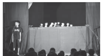
泉小学校「グッピーズ」で開演

各劇団の趣向をこらした作品は、どれもこれも見応え充分。子どもだけでなく、大人もいつの間にか作品の世界に引き込まれていきます。