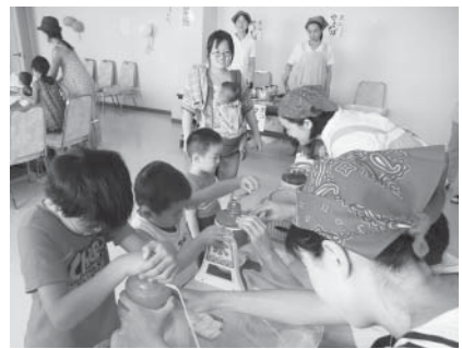
みんなでかき氷作り!

8月18日(木)、西東京市民会館にて、東北の各県から西東京市に避難されているお子さんとそのご家族に向けて、東北キッズフェスタを開催しました。お子さん向けには遊び、工作、電車などのコーナー、お母さん向けには西東京市の情報、談話コーナーなどを設けました。遊びコーナーでは、児童館職員の協力のもと、みんなでゲームを楽しみ、遊んだあとはおやつコーナーへ。ずんだもちや福島県のB級グルメ浪江焼きそばを作り、ふるさとの味を楽しみました。