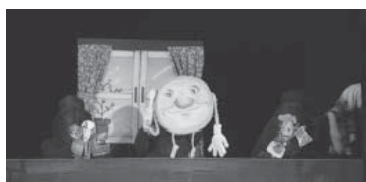
公民館の保育付講座から出発した人形劇サークル「くまねずら」

また500人収容の公会堂では、西東京市芝久保町に稽古場を持つ「人形劇団ブーク」の人形劇が上演され、プロによる本格的な舞台を楽しみにしていた親子で、会場は埋め尽くされました。