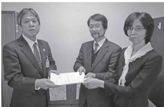
報告書が教育長に提出されました

この度、これまでの協議内容がまとまり、平成26年2月20日に会長・副会長から教育長へ報告書が提出されました。報告書の詳細は、市情報公開コーナーや市ホームページで公開しています。今年度は、建替協議会を設置し、これまでの2年間で建替準備検討協議会において協議してきた事項等を基に、ひばりが丘中学校の建替えについて検討を行う予定です。引き続き、関係者から丁寧な意見をお聞きし、よりよい教育環境の実現に向けて取組を進めてまいりますので、皆様のご理解とご協力をお願いいたします。