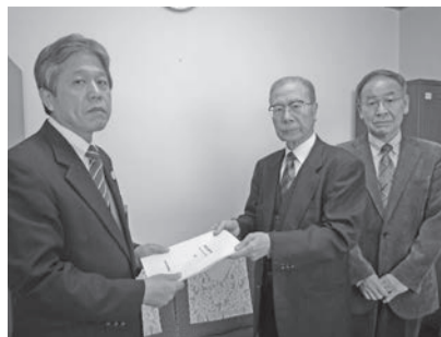
教育計画(案)が教育長に提出されました

西東京市教育委員会では、「西東京市教育委員会の教育目標」を掲げるとともに、この教育目標に則して、「西東京市教育計画(平成26年度～平成30年度)」を策定しました。