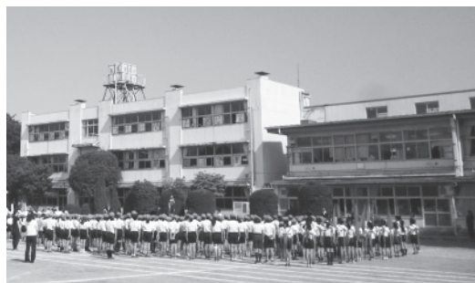
現在の中原小学校

建替協議会は、学識経験者、児童の保護者、学校運営連絡協議会委員、学校安全連絡会委員、民生・児童委員、青少年育成会の会員、保育園又は幼稚園の園児の保護者、学校長で構成されています。