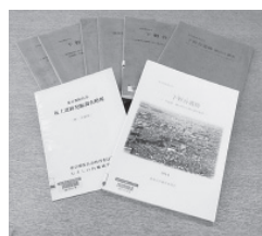
1973年からの下野谷遺跡調査報告書

下野谷遺跡に関する記述がある図書14タイトル、発掘調査報告関係資料34タイトルとともに、その他の市内遺跡に関する資料も掲載しています。平成15年発行の「西東京市の縄文大集落下野谷遺跡」は、PDF